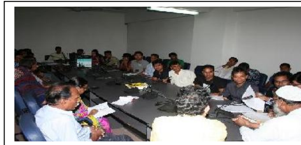
ব্যাঙ্গডক-এর মহাপরিচালক ইন্টার্নশীপ গ্রহণকারী ছাত্র-ছাত্রীদের মাঝে ক্লাস নিচ্ছেন