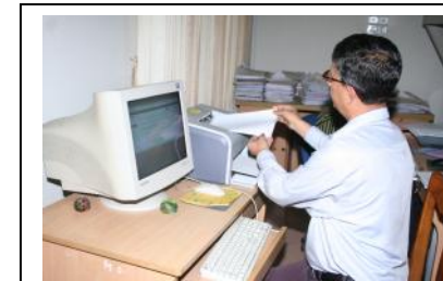
বিজ্ঞানী ও গবেষক-কে ডকুমেন্টে প্রিন্ট দেয়া হচ্ছে

এ ছাড়া ব্যঙ্গডক-এর প্রবেশাধিকার আছে এমন কিছু বিদেশী ওয়েবসাইট (HINARI, AGORA, INASP PERii ইত্যাদি) হতে ডকুমেন্ট সংগ্রহ করে থাকে।