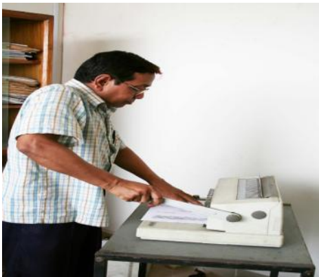
গ্রাহক সেবার জন্য লেমিনেটিং করা হচ্ছে