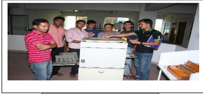
টার্ন ইন্সপীপ গ্রহণকারীদের ফটোকপি মেশিন পরিচালনা প্রশিক্ষণ

গবেষকদের গবেষণা কর্ম, ফটোগ্রাফ ইত্যাদি মাইক্রোফ্লিম, মাইক্রোফিস-এর মাধ্যমে দীর্ঘ মেয়াদে সংরক্ষণের ব্যবস্থা এ সেবার আওতায় করা হয়। এ ছাড়া গবেষণার বিষয়বস্তুর বৈজ্ঞানিক ফটোগ্রাফি, স্কাইড তৈরীর ব্যবস্থাও এখানে বিদ্যমান। তবে তথ্য প্রযুক্তির ব্যাপক প্রসারের ফলে এ সব সেবার চাহিদা নেই বললেই চলে। তবে গবেষকগণ তাদের গবেষণা পত্র বা অন্য কোন ডকুমেন্ট লেমিনেটিং, স্পাইরাল বাইন্ডিং, ফটোকপি স্বল্প মূল্যে এ বিভাগ হতে করে নিতে পারেন।