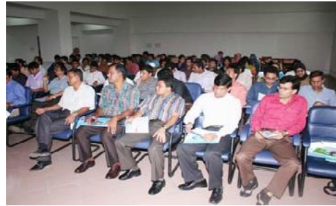
জগন্নাথ বিশ্ববিদ্যালয়ে সেমিনার