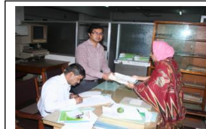
বিজ্ঞানী ও গবেষক ডকুমেন্টেশন সেবা নিচ্ছেন

গবেষকগণ তাদের গবেষণার সাথে সংশ্লিষ্ট অন্যান্য গবেষণার ফলাফল জানার জন্য প্রকাশিত আর্টিক্যাল সংগ্রহ করে থাকেন। ব্যক্তিগত প্রচেষ্টায় অথবা ব্যঙ্গডক বা অন্যান্য লাইব্রেরী/ডকুমেন্টেশন সেন্টারে প্রকাশিত আর্টিক্যালের বিবলিওগ্রাফি বা এ্যাবসট্রাক্টস পাওয়া গেলেও গবেষণার বিস্তারিত বিবরণ সম্বলিত আর্টিক্যাল সংগ্রহ করা ব্যক্তির পক্ষে অসম্ভব হয়ে পড়ে। গবেষকদের এ ধরনের আর্টিক্যাল সংগ্রহের চাহিদার প্রেক্ষিতে ব্যঙ্গডক দেশ-বিদেশের বিভিন্ন তথ্য কেন্দ্র থেকে ডকুমেন্ট সংগ্রহ করে চাহিদাকারী গবেষকদের সংরবরাহ করে থাকে। প্রথমতঃ ব্যঙ্গডক-এর ডকুমেন্টেশন বিভাগ ব্যঙ্গডক-এর নিজস্ব তথ্য ভান্ডার হতে সংশ্লিষ্ট ডকুমেন্ট সংগ্রহের চেষ্টা করে থাকে। ব্যঙ্গডক-এর নিজস্ব প্রকাশনা ন্যাশনাল ক্যাটালগ অব সায়েন্টিফিক এন্ড টেকনোলজিক্যাল পিরিওডিক্যালস ইন বাংলাদেশ অথবা দেশের অন্যান্য লাইব্রেরী হতে আর্টিক্যাল সংগ্রহ করে তা গবেষকদের প্রদান করে থাকে।