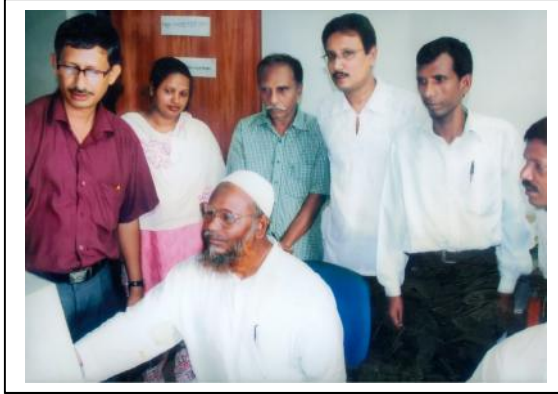
ব্যঙ্গডক-এর মহাপরিচালক কম্পিউটার প্রশিক্ষণ দিচ্ছেন