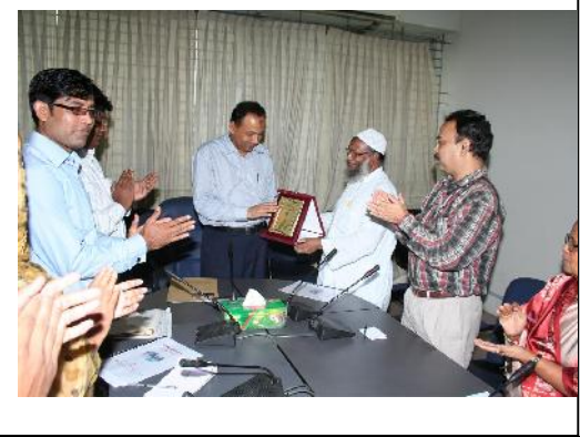
মাননীয় সচিব-এর হাতে ফ্রেম তুলে দিচ্ছেন মহাপরিচালক

২০১১-২০১২ অর্থ বছরে ১৪১ জন গবেষক এ তথ্য সেবা গ্রহণ করেছেন। ৪,৮৫৯ টি রেফারেন্স গবেষকদের মাঝে সরবরাহ করা হয়। এর বিনিময়ে সরকার ৪৮,৫৯৮/- টাকা রাজস্ব আয় করে কিন্তু প্রকৃত পক্ষে এ ধরনের সেবা অর্থ দিয়ে মূল্যায়ন করা যায় না। দেশে গবেষণার ক্ষেত্রে এ সেবার গুরুত্ব অপরিসীম।