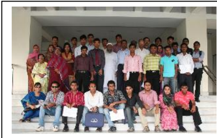
ব্যাঙ্গডক-এ ইন্টার্নশীপ গ্রহণকারী ছাত্র-ছাত্রী