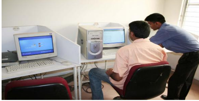
ব্যাঙ্গডক সাইবার কর্ণার

ব্যাঙ্গডক গ্রন্থাগারে একটি সাইবার কর্ণার সংযুক্ত করা হয়েছে। আপাততঃ দু'টি কম্পিউটারে ইন্টারনেট সংযোগ প্রদানের মাধ্যমে এর কার্যক্রম শুরু হয়েছে। গ্রন্থাগার ব্যবহারকারীরা বিনামূল্যে এ সাইবার কর্ণারে ইন্টারনেট ব্যবহার করতে পারেন ও প্রয়োজনীয় ডকুমেন্ট স্বল্প মূল্যে প্রিন্ট করে নিতে পারেন।