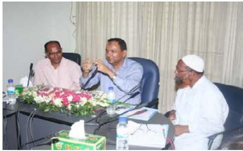
পরামর্শ সভায় মাননীয় সচিব মহোদয়